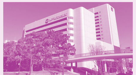
▲神戸商工会議所会館 神商ホール